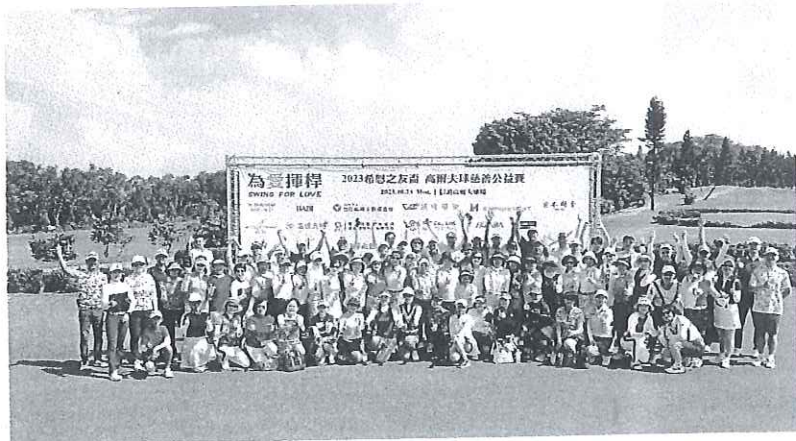
舉辦「為愛揮桿」高爾夫球公益慈善賽,當天有116位善心球友參與