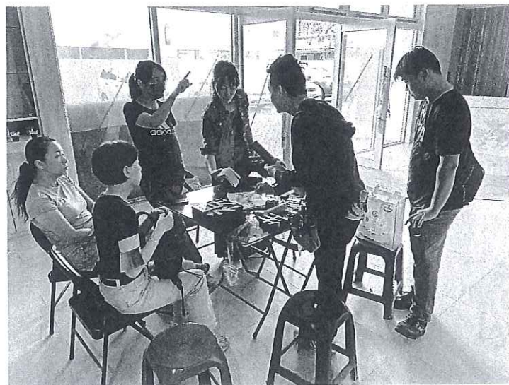
定期工務會議,監督工程進度