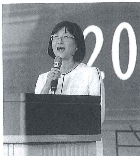
社會局-葉玉如副局長蒞臨勉勵