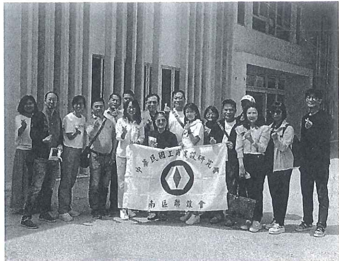
感謝各界團體參訪,捐贈家園各項設備