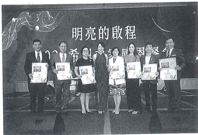
感謝長期支持的愛心企業