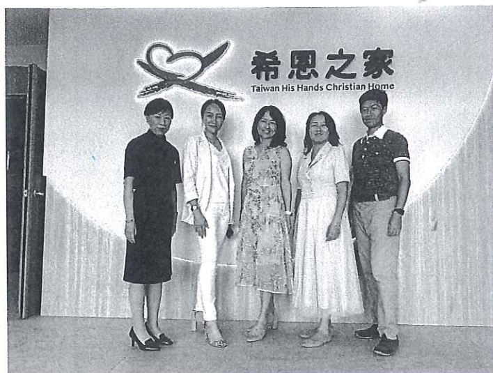
感謝董事會辛勞,築家工程完工;於 112 年 11 月 24 日辦理開幕儀式